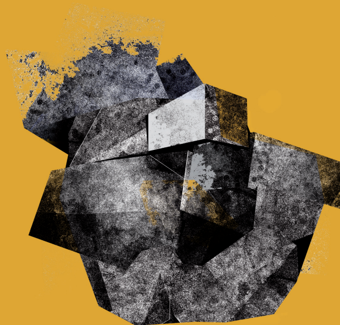
Z cyklu Zasiałem białe ziarno - płynie, a łódź moja coraz bliżej dna, 2023, druk cyfrowy, 70x70 cm

Prace w zbiorach: Galerii Test w Warszawie (kolekcja „Warszawska Grafika Miesiąca”), Stowarzyszenia Międzynarodowe Triennale Grafiki w Krakowie, Muzeum Narodowe w Kielcach, International Biennial of Miniature Art Timisoara, Miejska Biblioteka Publiczna w Gliwicach (ex librisy), Centrum Sztuki Współczesnej Toruń (ex librisy), Wspólnota Gdańska (ex librisy), „Liuben Karavelov” Regional Library – Ruse, Bułgaria (ex librisy).